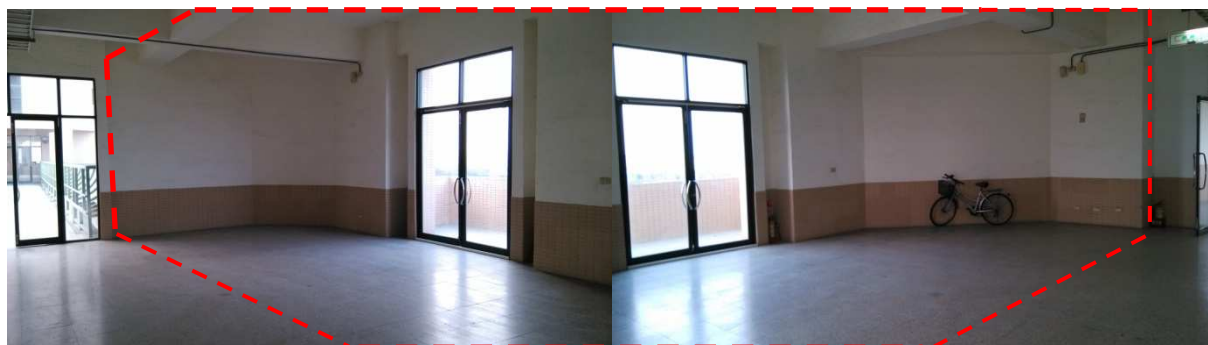
管理學院大樓 527 通道空間照片(紅色虛線範圍)